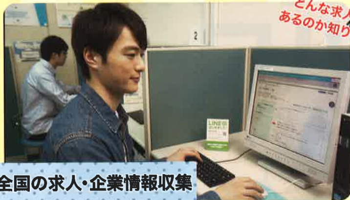
全国の求人・企業情報収集