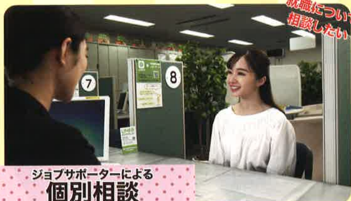
ジョブサポーターによる 個別相談