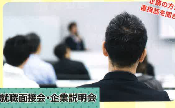
就職面接会・企業説明会