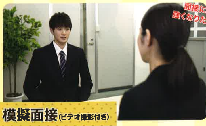
模擬面接 (ビデオ撮影付き)